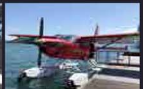
世界遺産 百舌鳥・古市古墳群 上空からの遊覧見学も一案!