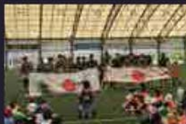
ラグビーW杯! プレイブ プロッサム 堺でも大会前最後の調整。

〒593-8312 堺市西区草部 82 TEL : 090-9457-6426 FAX : 072-228-5902