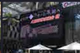
長岡市 中心市街地に行政機関を 配置し、賑わい創出。